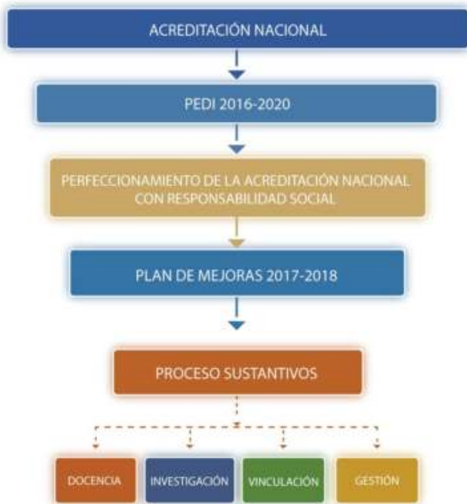
Gráfico 1 Estructura de Rendición de Cuentas 2017