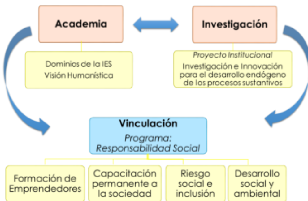
Gráfico 4 Modelo de Vinculación

En este objetivo se estructuró un modelo que permite tener una idea esencial de como el tecnológico de Formación genera la vinculación con la sociedad en el instituto