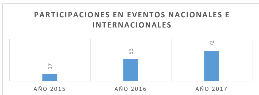
Gráfico 2 Docentes participantes en eventos

Como se puede valorar en la gráfica el crecimiento investigativo es significativo los docentes de la institución se concientizaron de lo importante que es este proceso para la institución