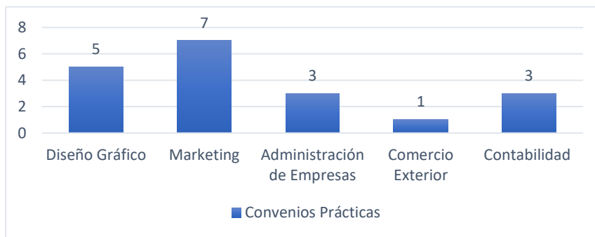
Gráfico 6 Convenios realizados de Prácticas Pre Profesionales

En este objetivo se realizaron convenios con empresas públicas y privadas con la finalidad de brindar mayores oportunidades a los estudiantes para la realización de las prácticas pre profesionales