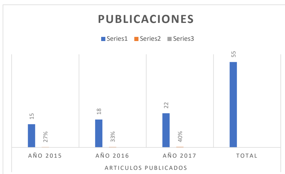
Gráfico 3 Publicaciones

Como se puede valorar en la gráfica el crecimiento investigativo es significativo los docentes de la institución se concientizaron de lo importante que es este proceso para la institución